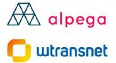
Bolsa de Carga